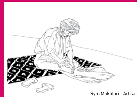
Rym Mokhtari - Artisan

Participation aux frais : 3€ Réservation souhaitée : atelier@institut-cultures-islam.org